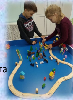
сюжетно—ролевые игры комната интерактивного досуга