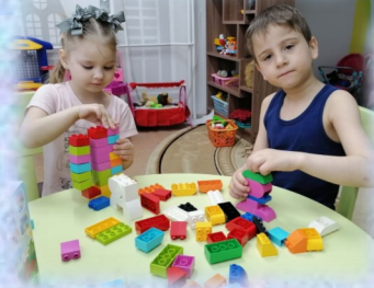
интерактивные игры леготерапия