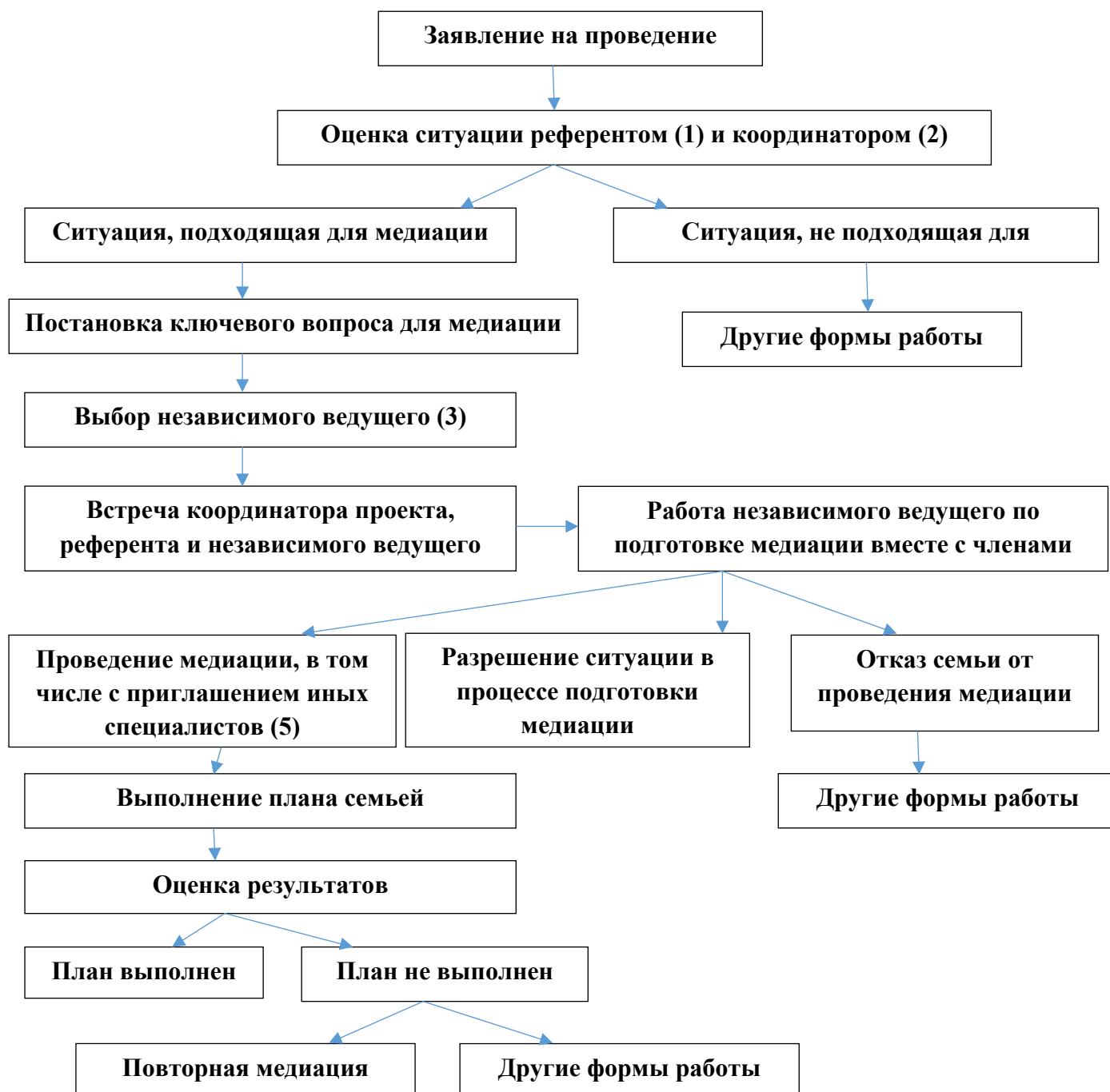
Рис. 2 Алгоритм подготовки и проведения медиации

Медиация имеет открытую структуру с определенными этапами (рис. 2), где четко определены роли различных участников.