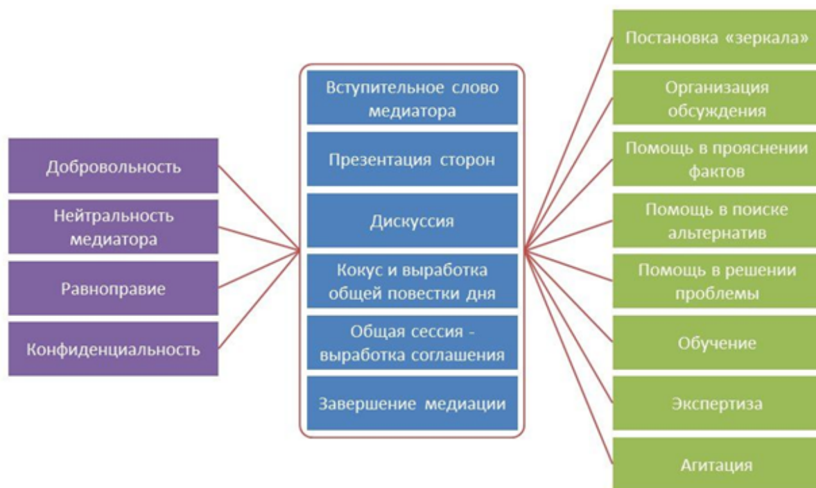
Рис. 1. Процедура медиативной технологии в работе специалистов, оказывающих услуги женщинам, находящимся в трудной жизненной ситуации, социально опасном положении, подвергшихся семейному насилию

1-й этап медиации - вступительное слово медиатора (рис.1). Во вступительном слове медиатор рассказывает сторонам, что такое процесс медиации, на каких принципах он построен (особое внимание здесь стоит уделить конфиденциальности), объясняет свои функции в этом процессе и свою роль в предстоящих переговорах, знакомится со сторонами и представляется сам, рассказывает сторонам, какую роль они играют в предстоящих переговорах, спрашивает у сторон, располагают ли они достаточным временем для ведения переговоров (если хотя бы одна из сторон не располагает достаточным временем, в среднем 2,5-3 часа, то медиацию лучше перенести на более удобное время), все ли